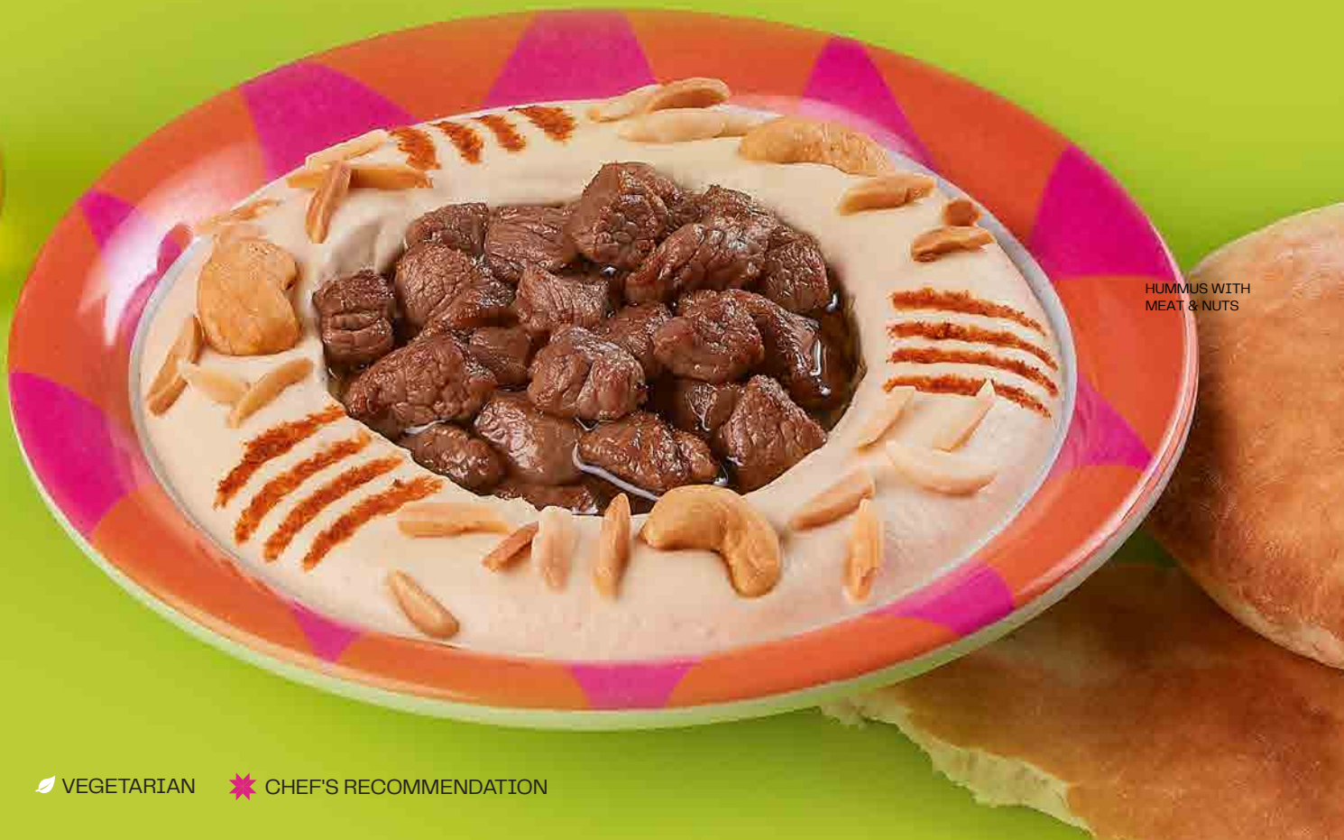
HUMMUS WITH MEAT & NUTS