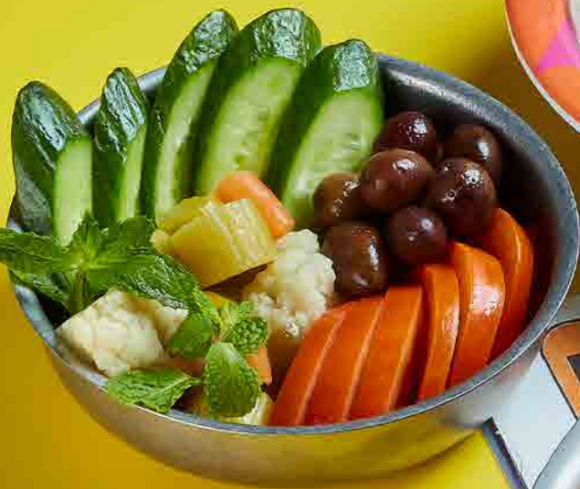
FRESH & PICKLED VEGETABLES PLATE