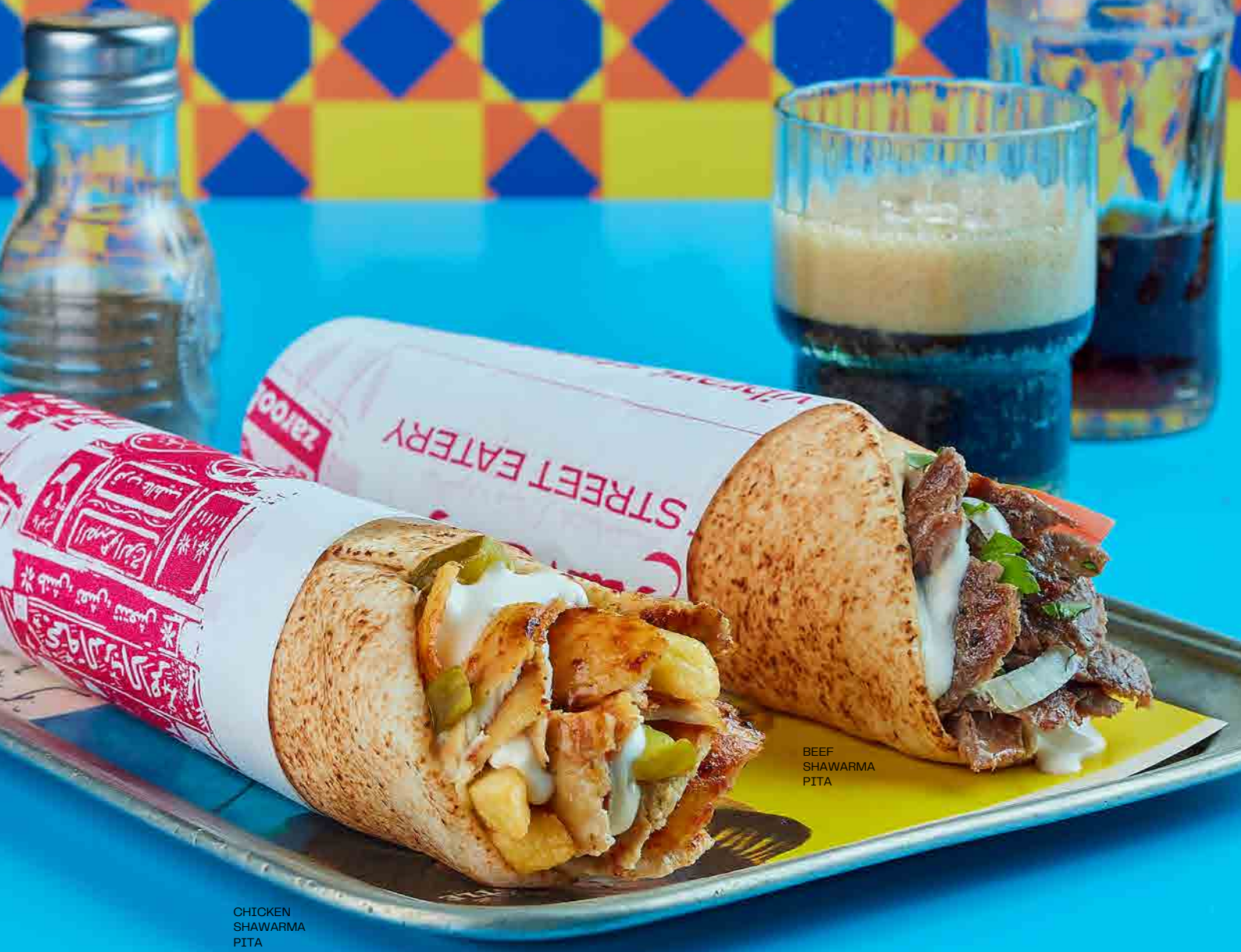
CHICKEN SHAWARMA PITA