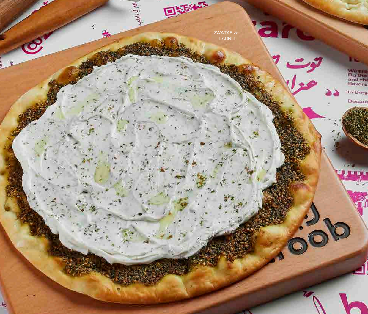
ZA'ATAR & LABNEH