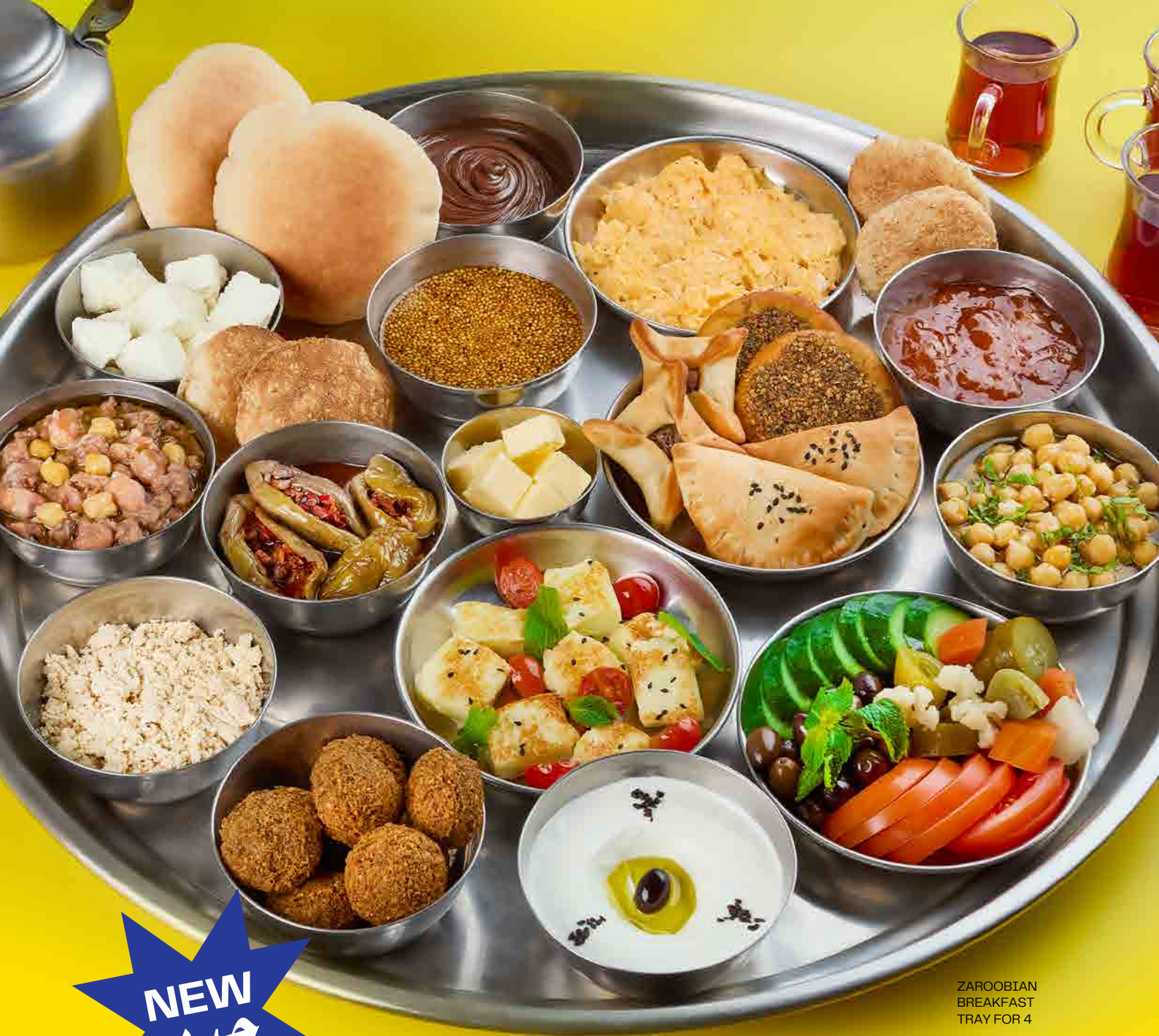
ZAROOBIAN BREAKFAST TRAY FOR 4