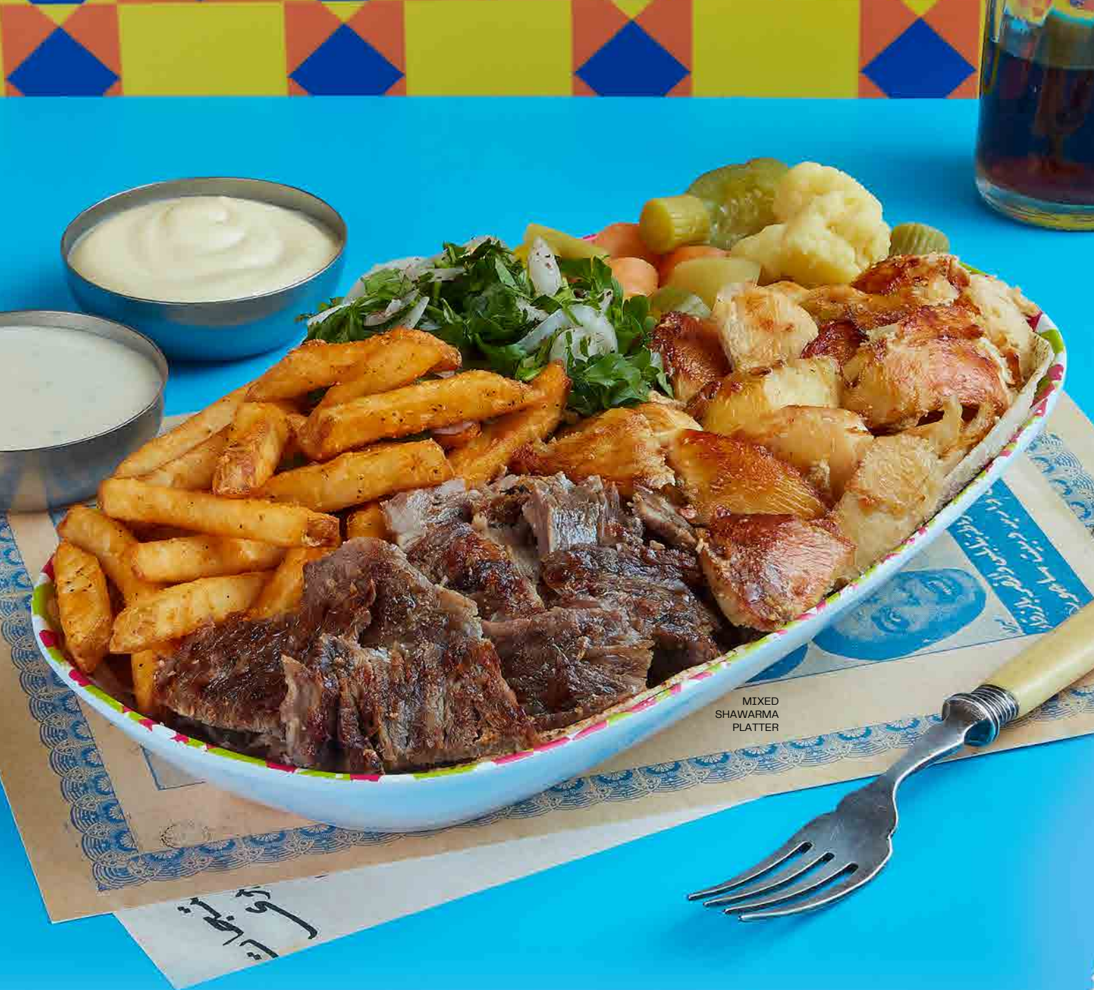
MIXED SHAWARMA PLATTER