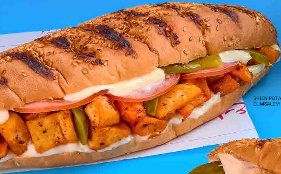
SPICY POTATO EL M3ALEM