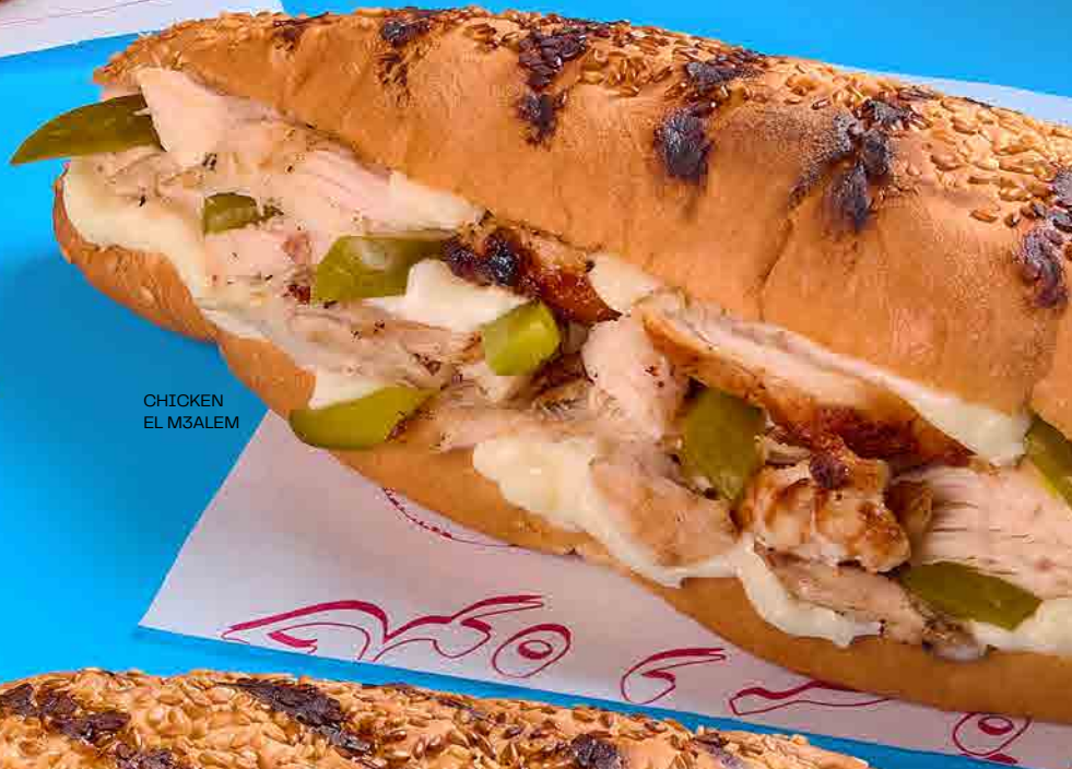
CHICKEN EL M3ALEM