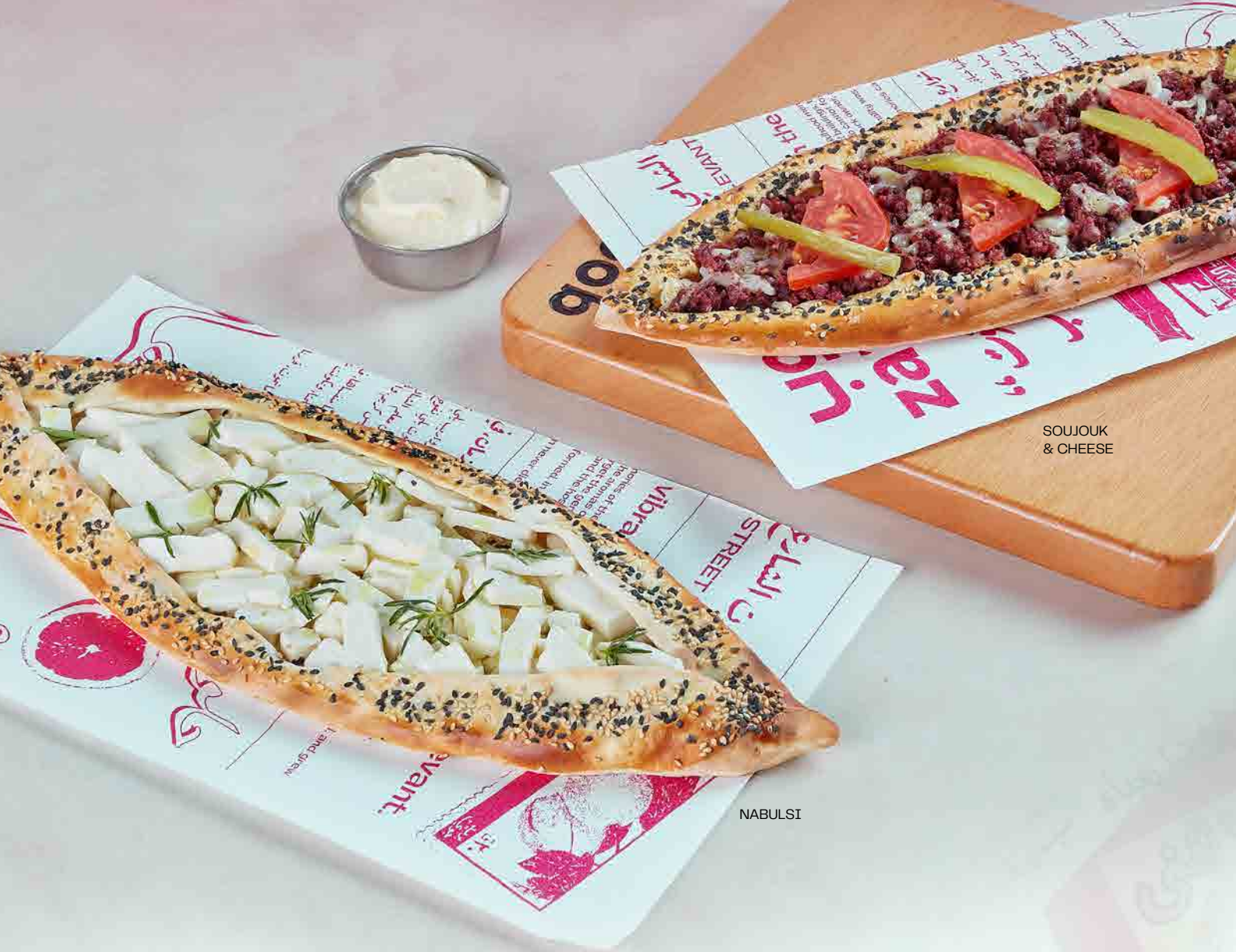
SOUJOUK & CHEESE