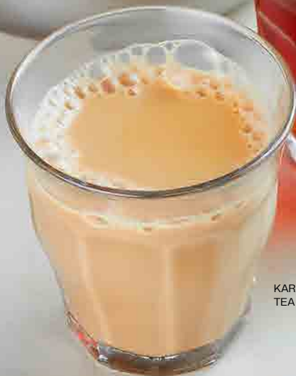
KARAK TEA POT