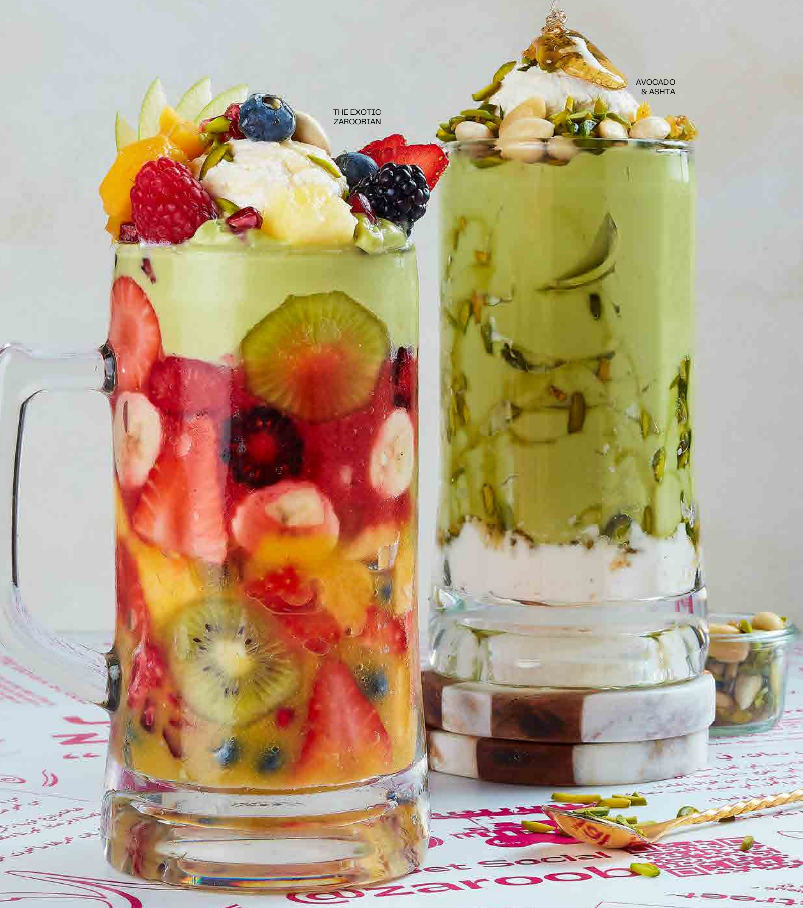
THE EXOTIC ZAROBIAN

عصير الأفوكادو مخلوط، مغطى بالقشطة، مكسرات مشكلة وعسل.