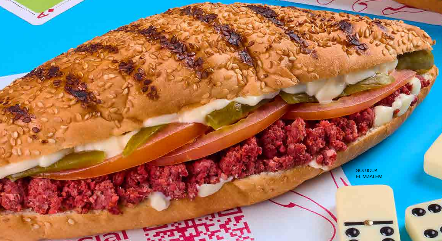
SOUJOUK EL M3ALEM