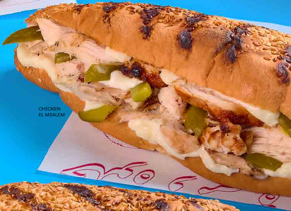
CHICKEN EL M3ALEM