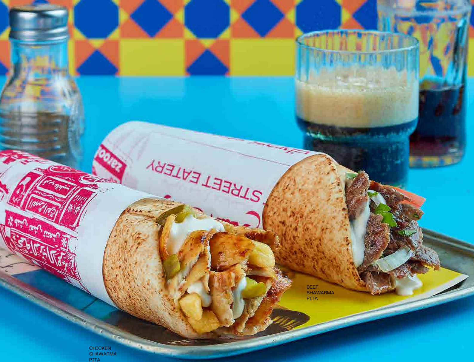
CHICKEN SHAWARMA PITA