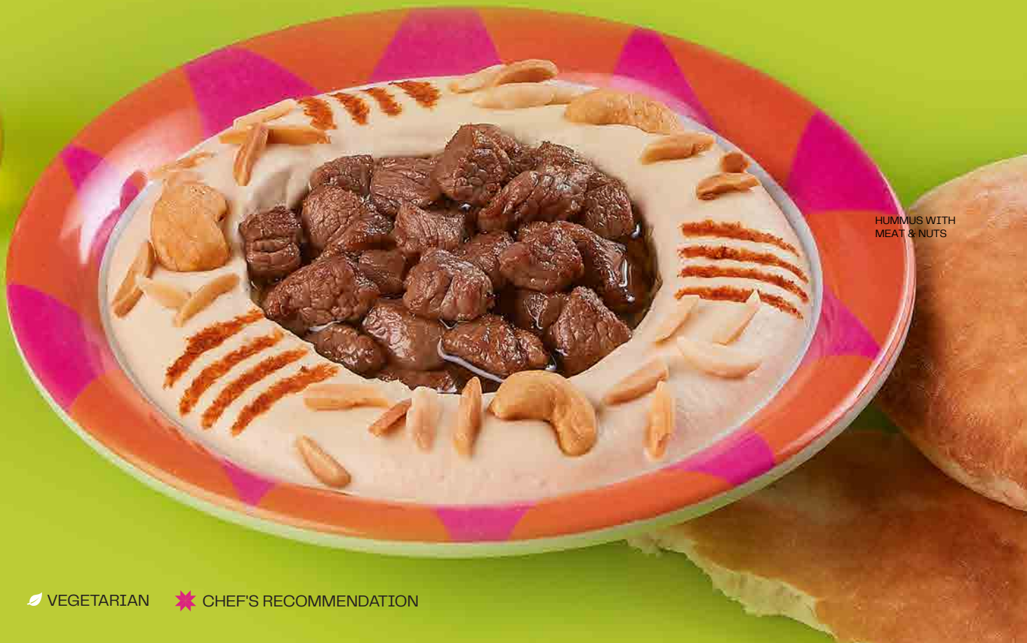
HUMMUS WITH MEAT & NUTS